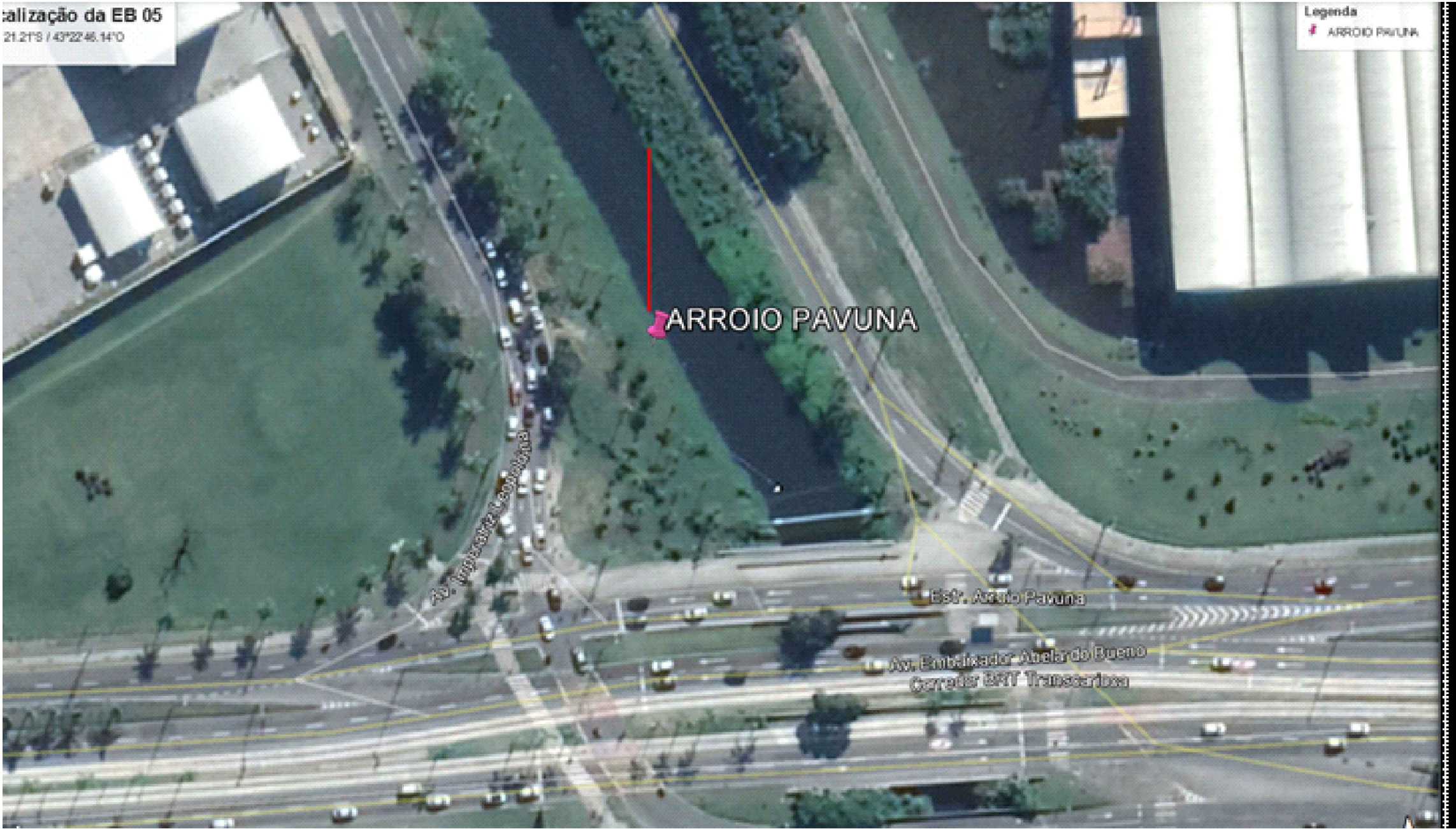
01 LOCALIZAÇÃO DA ECOBARREIRA DO RIO PAVUNA - EB 04 ESC: 1/500